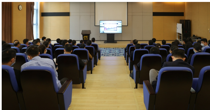
各会议室一级部门视频连线参加

社会发展日新月异，不同时期、不同阶段对素质的要求在不断提高。在奔涌向前的时代大潮前，在变化的市场环境中，在公司快速发展过程中，我们每个人都要始终保持一颗好奇心和进取心，与时俱进、加强学习，努力拼搏，不断提升素质。