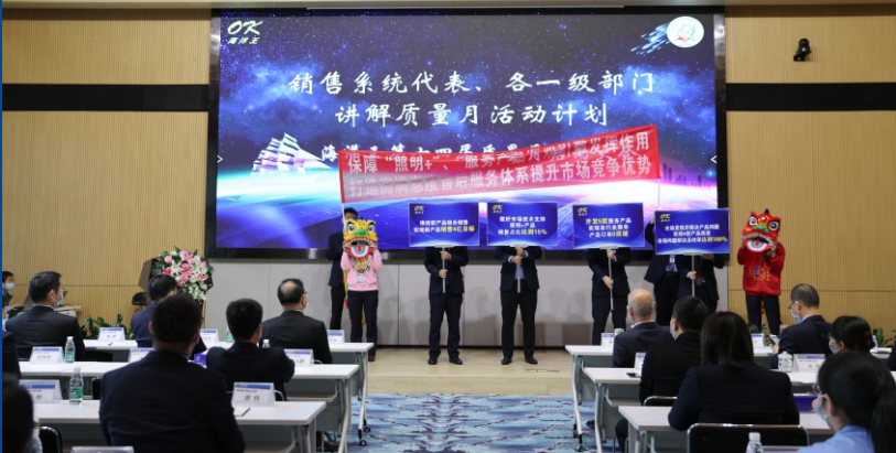
3月2日上午，质量月启动仪式在科技楼4楼多功能厅举行，公司领导、一级部门领导出席了会议，总部及供应链员工在各会议室视频连线参加了会议。（图为市场部员工进行主题诠释）