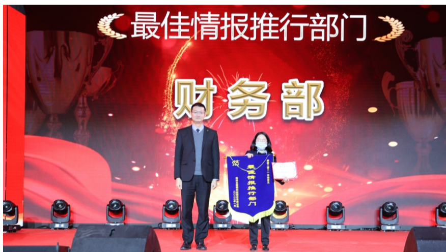
2021年度经营情报最佳推行部门：财务部