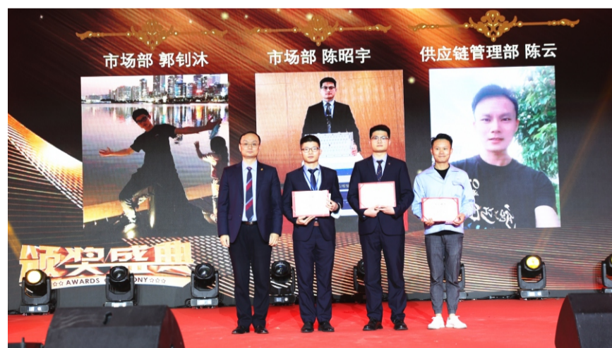
2021年度经营情报卓识奖