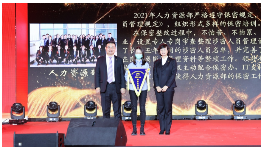
2021年度保密先进集体：人力资源部