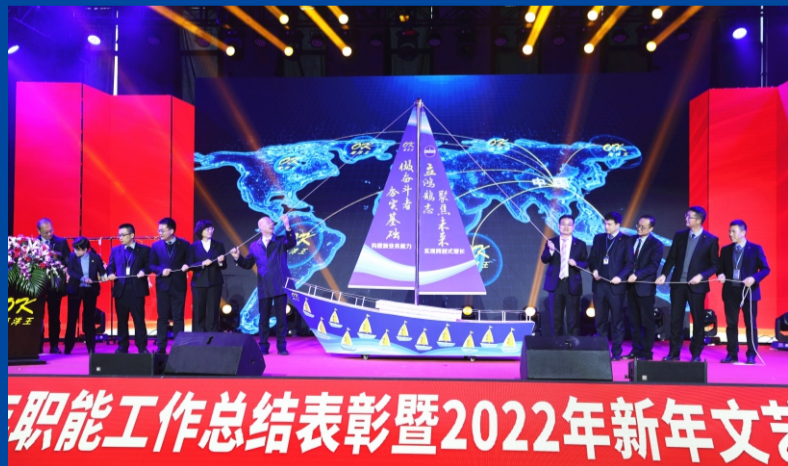
2月9日，公司2021年职能工作总结表彰暨2022年新年文艺汇演大会在海洋王科技楼举行。大会议程包括：战略宣讲、2021年度各项工作的先进个人和集体的表彰，颁授聘书、签署目标责任书、集体宣誓仪式等。

新的一年，让我们每个人都为自己的人生设定阶段性目标和长远规划，许下一个梦想，通过自己踏踏实实的工作，让梦想的种子在希望的沃土上发芽、开花、结果！