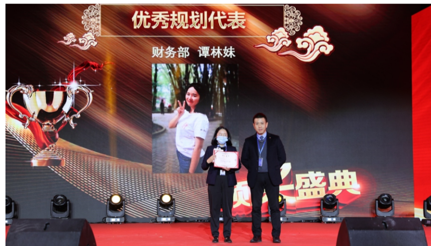
2021年度经营情报优秀规划代表