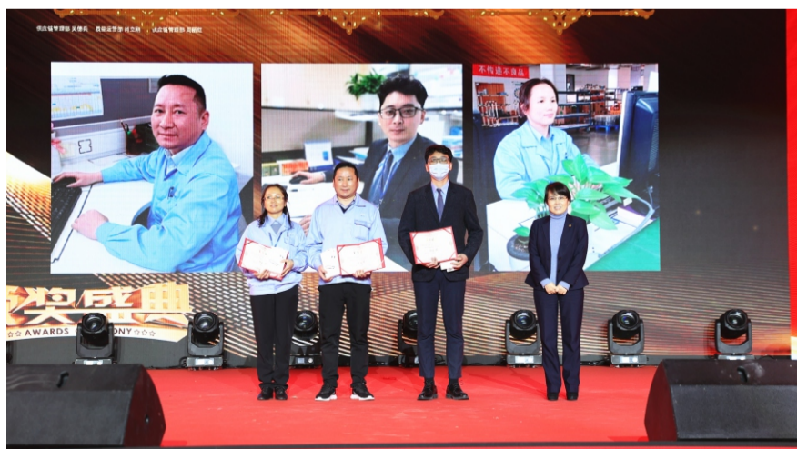
2021年度经营情报洞察奖