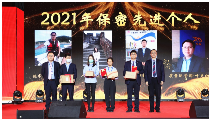
2021年度保密先进个人