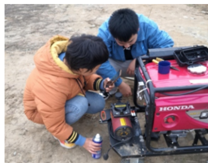
提前做好设备检查、维保

12月3日与客户一起在现场了解具体情况，预设灯具点位、预估灯具使用数量，力求为客户提供最佳的照明条件，为现场提供安全的施工条件。提前一天，为12月6日展示灯具照明效果做准备，提前确认好灯具数量，检查电源是否充足、机油液压油是否充足等等。