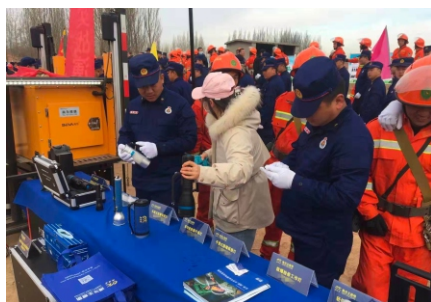
服务中心人员现场讲解、演示灯具

据悉，此次演练全市1000多名森林消防专业队员参演，动用飞机、无人机、消防车、灭火弹、车水带等各类装备300余件，地空立体协同作战，参演人数多，环节要素全，实战仿真性强，充分展现了各级各部门应对突发森林火灾的作战能力，为做好森林防火工作打下了坚实基础。