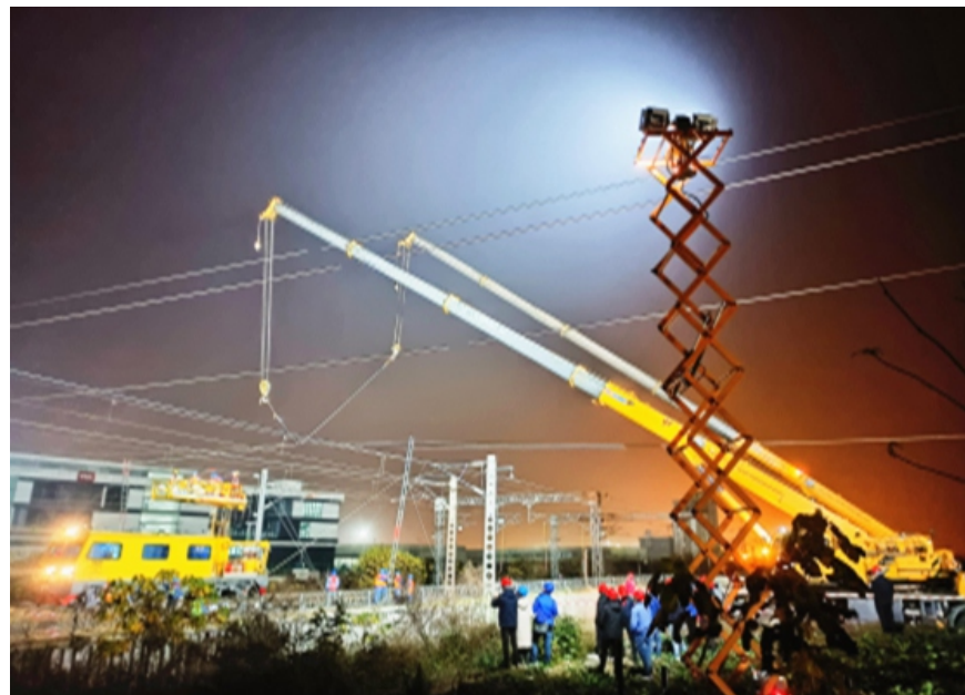
照明灯塔照亮施工作业现场