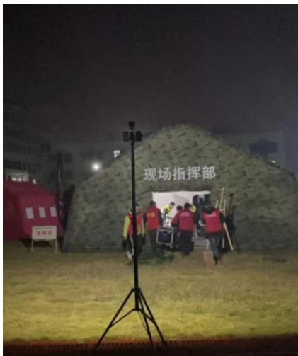
夜间7-10点， 为队员宿营生活区提供照明保障