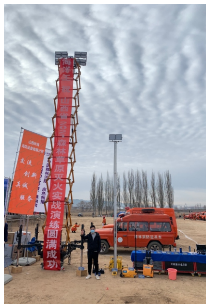
我司移动智能照明平台 矗立演练现场