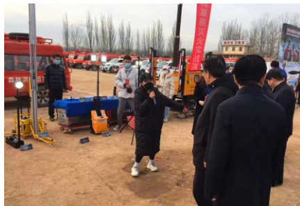
上图话筒连接了我司多功能移动照明平台，实现了现场的清晰介绍