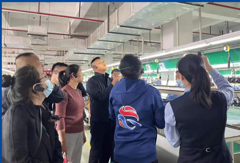
11月26日，由某自治州体育局副局长组织，带领自治州市各县文体旅的局长、副局长以及体育相关负责人一行24人，莅临海洋王深圳总部及东莞工业园考察交流。

不积跬步无以至千里，不积小流无以成江海。日常行为细节虽小，却是“天大的小事”。规范员工日常行为，提高员工职业素养，使其真正成为一种感染力、凝聚力、推动力，进而升华为一种海洋王品牌的名片，一种专业照明人的形象，一种健康向上的精神。