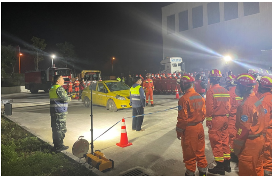
夜间6-7点，为夜间培训科目提供照明保障

为锤炼“真功夫”，以练为战，提升各救援队伍应急处置及协同配合能力，12月1日-3日，2021年重庆市安全生产应急救援队伍拉动集结联合训练在重庆市永川区举行。重庆公消服务中心应客户邀请参与联合训练。