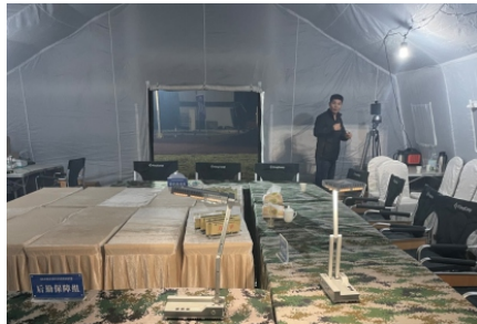
指挥帐篷内， 补充台面照明