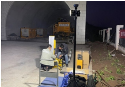
提前一天入场， 调试灯具及确认灯具布置