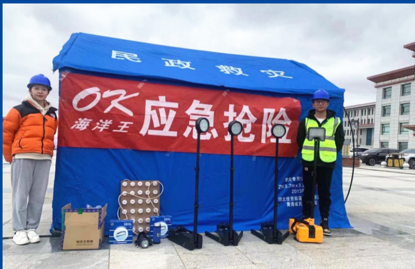
5月22日2时4分，青海省果洛藏族自治州玛多县发生7.4级地震。得知消息后，兰州电网服务中心西宁服务部立即联系当地应急部门和电力公司，紧急组织救援，调拨应急设备。两名90后员工奔袭几百公里路程，以最快的速度到达现场，积极配合客户单位进行地震救援的照明保障，兑现我们对客户的庄严承诺。

公司制度、标准和流程不只是纸上条文，更重要的是要体现在日常工作生活的方方面面。将公司制度内化于心、外化于行，对照标准，不断改正缺点、完善自我，严守制度这道保障我们事业前进的护城河。