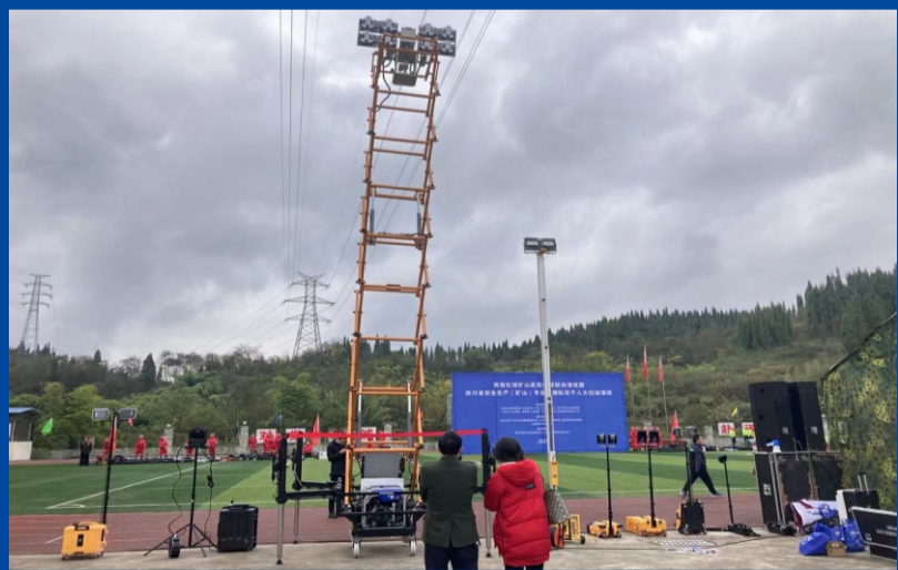
11月24日-26日，2020年西南区域矿山应急联动演练暨四川省安全生产(矿山)专业救援队伍千人大拉动演练活动在达州市和宜宾市同时举行。本次演练模拟四川省东南某地发生地震，重庆市、云南省、贵州省迅速调集队伍增援，25支安全生产(矿山)专业救援队伍团结协作、联合救援。海洋王配合客户，携带应急救援灯具参加演练，提供夜间救援照明支持。(图为成都公消服务中心在演练现场)

厂电事业部能够超越去年业绩，不是靠运气，而是靠凝聚人心，踏踏实实的做事，逆势而上的顽强拼搏实现的。希望公司其他事业部也能和厂电事业部一样，奋起直追，不给2020年留遗憾，以崭新、积极的心态迎接2021年。