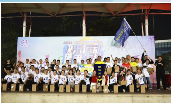
运动会团体亚军：品质保证部