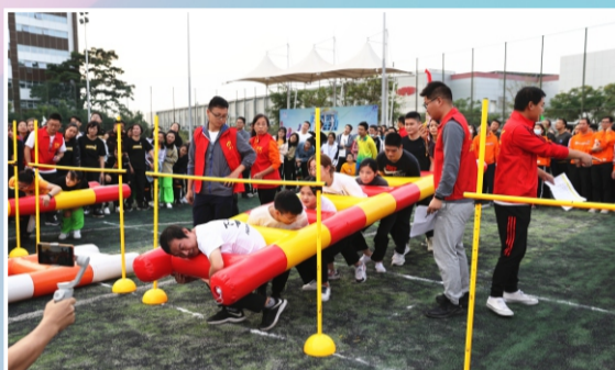
协力云梯，团结一致穿越障碍