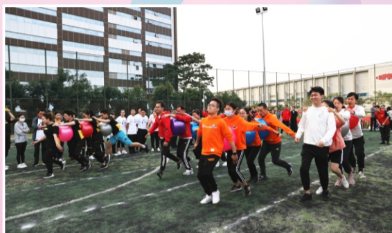
心心相连，团队协作默契配合