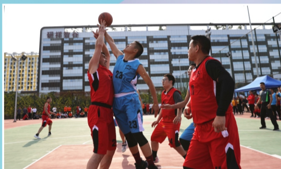
“好球！加油！”篮球争霸热火朝天