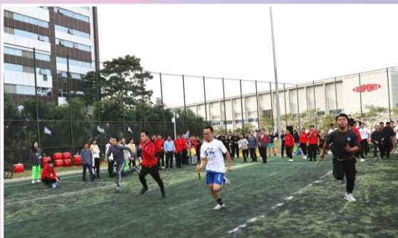
接力赛，向前冲冲冲，像风一样奔跑吧