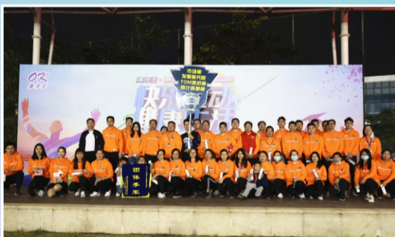
运动会团体季军： 市场部&发展研究院&TQM推进部&审计监察部