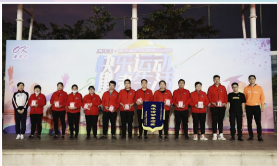
拔河比赛冠军、协力云梯冠军、心心相连冠军： 供应链管理组