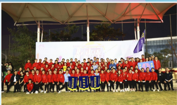
运动会团体冠军：供应链管理组