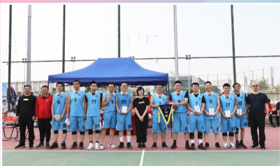
篮球赛冠军、最佳组织奖：供应链队