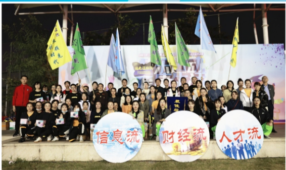
运动会最佳风采展示奖、最佳组织奖： 财务部&人力资源部&管理学院&管理优化部