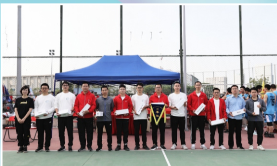
篮球赛季军：技研队