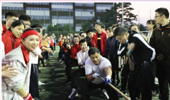
领导队参与拔河比赛，现场气氛推向高潮