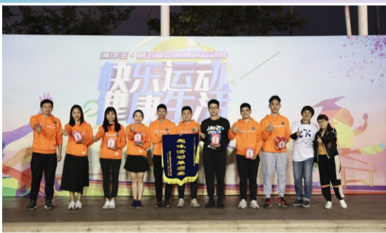
8*30米接力冠军： 市场部&发展研究院&TQM推进部&审计监察部