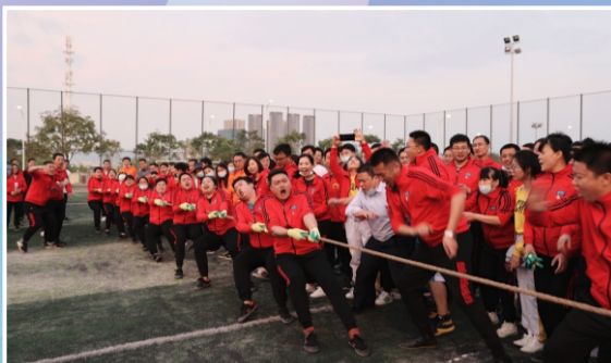
齐心协力拔河，拉拉队加油助威，响声震天