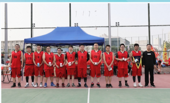
篮球赛亚军：事业部队