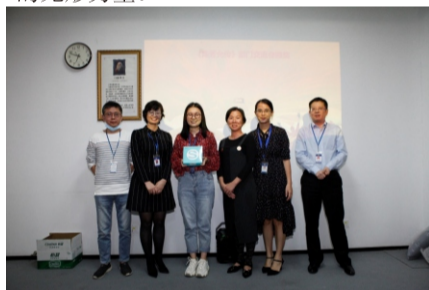
财务部《陈芳允传》优秀征文一等奖

读书是幸福的，读书也是一种享受。在读书交流会最后，陈总说，我们在读《陈芳允传》的时候，不仅要了解他的生平事迹，着重要把陈芳允读透、读懂，深入到陈芳允的精神世界中，将自己融入到其中，享受与主人公思想交流的过程，让陈芳允的精神、品格成为自身一部分，使之成为工作和生活进步的无形力量。