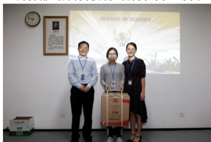
财务部《陈芳允传》优秀征文二等奖