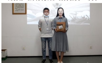
财务部《陈芳允传》优秀征文三等奖